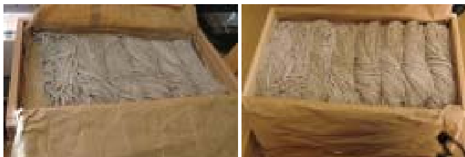
お弟子さんの打った蕎麦