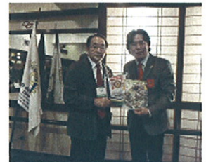
バナー交換する新関パストガバナー