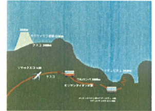
ペルーの首都リマよりクスコ経由でマチュピチュの世界遺産へ